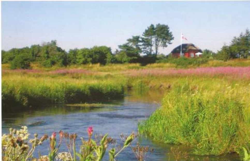
Karup Å ved Sønder Resen