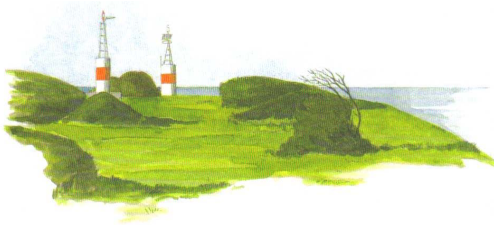
Fyr på spidsen af Asnæs - tegn.: Kurt Petersen