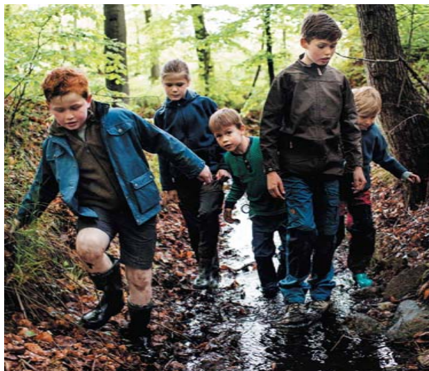
Kommende brave sportsfolkere undersøger et skovvandløb på Naturens Dag.

September 2014 - nr. 2 Kalundborg Sportsfiskerforening