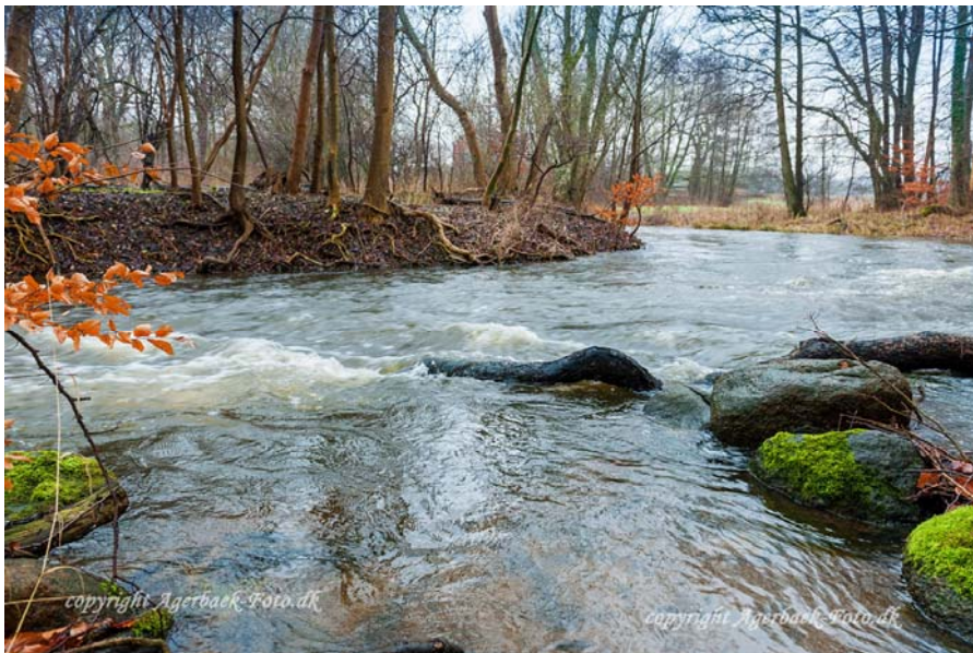
Halleby Å i Hejrebjerg skov - tæt på Øresø Mølle.

Vandrådet har repræsentanter fra alle organisationer, der har berøring med vores vandløb, så det er alle landbrugsinteresser, vandforsyningen, Danmarks Naturfredningsforening, Friluftsrådet, DOF, og DSF.