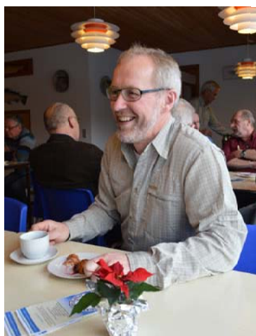
En glad og stolt formand.