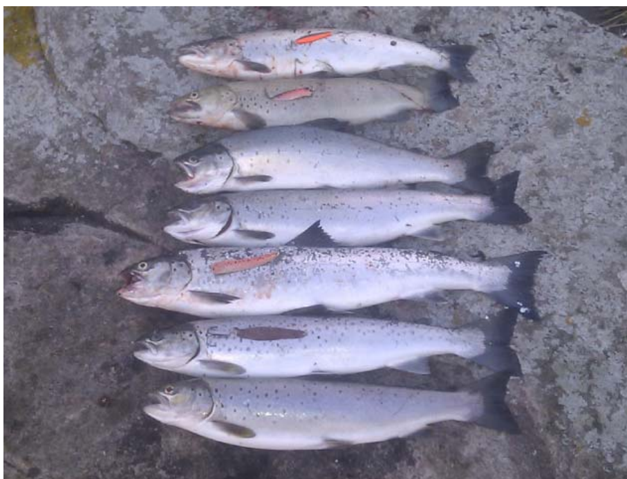
En håndfuld kolde, men blanke "Bornholmere", snuppet på Skansen mellem Snogebæk og Neksø

Jeg følte mig dog overbevist om at skansen stadig holdt fisk så jeg gik lidt dernedad på ét af de utallige rev.