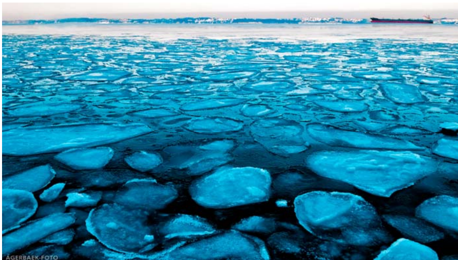
Kalundborg Fjord i vinterdragt - foto: Ole Agerbæk.

Marts 2013 - nr. 1 Kalundborg Sportsfiskerforening