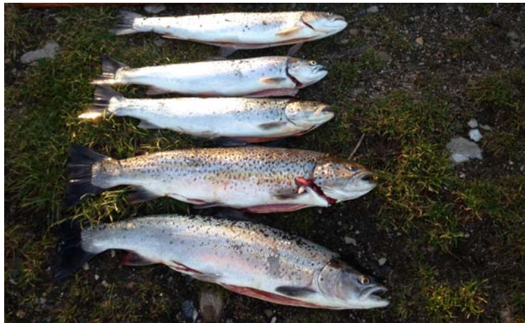
5 flotte fisk, fanget af brave sportsfiskere på Gammel Dansk Turen, den 4. januar

Januar 2015 - nr. 1 Kalundborg Sportsfiskerforening